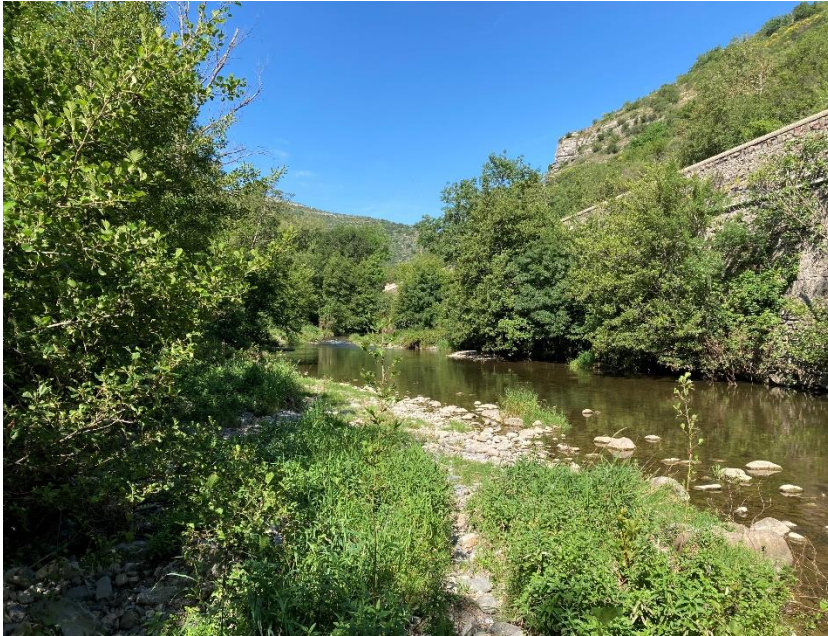
La rivière Ouveze entre Le Pouzin et Rompon

Nous avons abordé l'importance de préserver les ripisylves (les forêts en bord de cours d'eau) dans la précédente infolettre. Pour que ces forêts d'exception puissent perdurer dans notre environnement, il apparaît essentiel de redonner aux rivières altérées par les aménagements et les activités humaines un fonctionnement naturel.