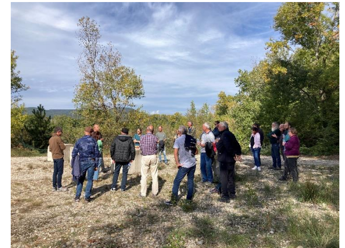
Visite du site du COFIL de l'ancienne carrière Joly à Donzère gérée par EDF

Le 8 décembre aura lieu le comité de pilotage du site « Rompon, Ouvèze, Payre » à Saint-Symphorien-sous-Chomérac.