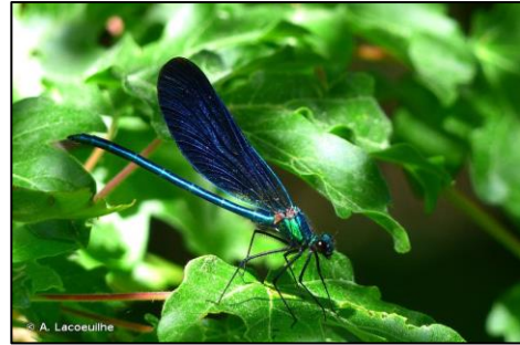
Figure 1 : Libellule Calopteryx virgo

Les participants ont pu observer la grande hauteur du barrage de la Selve, ainsi que son état vétuste. Alexandre Saussac a commenté la zone sans eau de surface en amont du barrage : l'eau s'infiltre dans les sédiments et s'écoule en pied de barrage, celui-ci étant endommagé. Le contraste avec la zone aval est saisissant. Avec l'eau de surface, la vie réapparaît. Ainsi les participants ont pu observer des libellules ( Calopteryx virgo par exemple), des Ecrevisses à pattes blanches, des jeunes truites... Guillaume Chevalier, animateur Natura 2000 du site « Vallée de l'Eyrieux et ses affluents » a expliqué comment reconnaître l'Ecrevisse à pattes blanche : forme triangulaire du rostre et présence d'une petite épine derrière chaque œil. La couleur de l'individu n'est pas un critère d'identification fiable étant donné qu'il dépend du milieu. Il a également évoqué son alimentation opportuniste constituée de végétaux et de petits invertébrés. Cette espèce est présente sur le Mézayon mais a subi un fort déclin il y a plusieurs années.