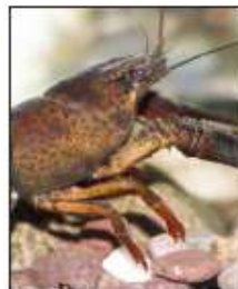
La zone Natura 2000 du Mézayon abrite trois espèces sensibles : l'écrevisse à patte blanche ainsi que deux poissons : le barbeau méridional et le blageon.

Dans les années 1990, le Mézayon a été sujet à plusieurs pollutions au chlore liées à la présence d'une usine de javel. Depuis, la situation s'est améliorée. Le cours d'eau n'est pas soumis à d'importants rejets de stations d'épuration comme ce fut le cas pour l'Ouvèze. Un programme visant à rendre plus performant l'assainissement autonome des riverains a également permis d'améliorer la qualité de l'eau. Toute la rivière est en gestion patrimoniale avec une interdiction de déverser du poisson d'élevage. « On travaille sur la qualité du milieu pour permettre aux truites sauvages, avec une très belle souche dans ce secteur, de se reproduire », explique Marc Doat, le président de la fédération de pêche.