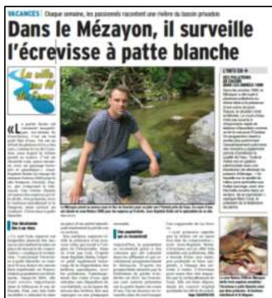
Figure 3 : Article du Dauphiné Libéré sur le Mézayon