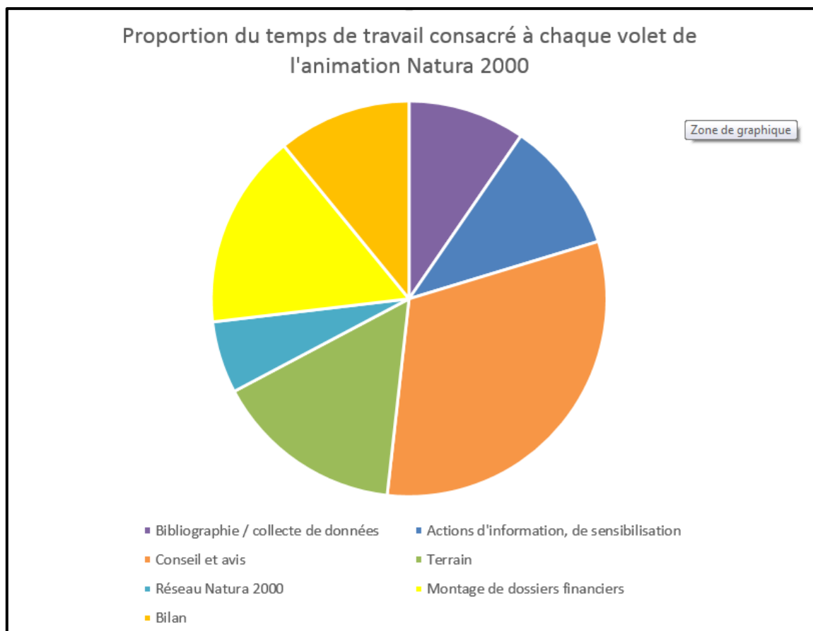
Figure 6 : Graphique représentant la proportion du temps de travail consacré à chaque volet de l'animation Natura 2000 pour l'année 2016

Au final, le nombre de jours consacré à l'animation Natura 2000 du site B25 est de 45 et le nombre de jours d'animation communs aux deux sites, ZPS12 et B25 s'élève à 36,25.